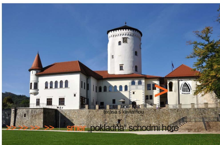
> Zjazd slovenských archeológov